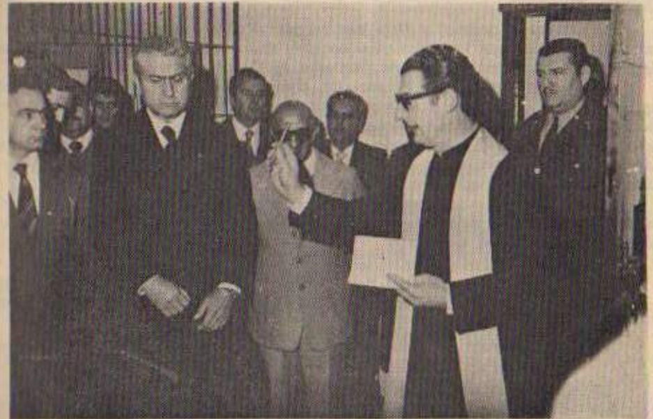
Momento en que son bendecidas las obras de los dos nuevos pabellones de la Unidad 6 (Dolores), inaugurada el 18 de julio de 1980.