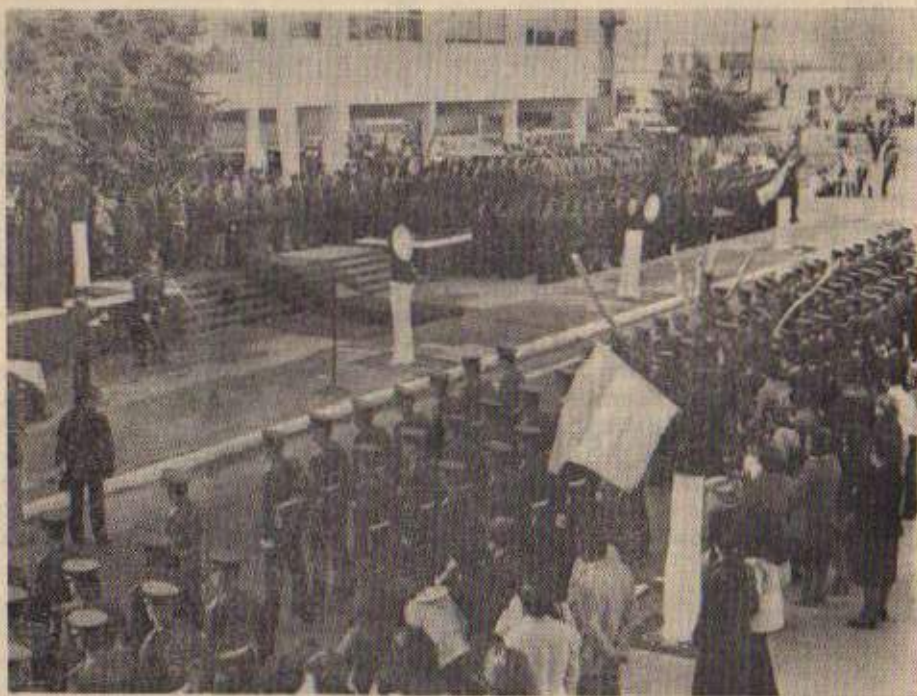
Ceremonia de Jura de la Bandera, por parte de los Cadetes de la Institución, efectuada el 20 de junio de 1980, frente a la Jefatura del Servicio Penitenciario de la Provincia de Buenos Aires.

En lo que respecta a la faz cultural, educacional y espiritual se cumplimentó con lo pautado.