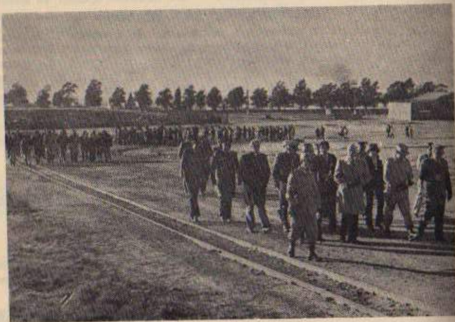
Recorrida por la zona de canteras de la Unidad 2 —Sierra Chica— por parte de las autoridades y de los jóvenes estudiantes y profesionales que la visitaron.

Reparación de 10 automotores, elaboración de 7.000 Kgs. de fideos, lustrado de un juego de comedor. Confección de 300 camisas de lienzo para internos.