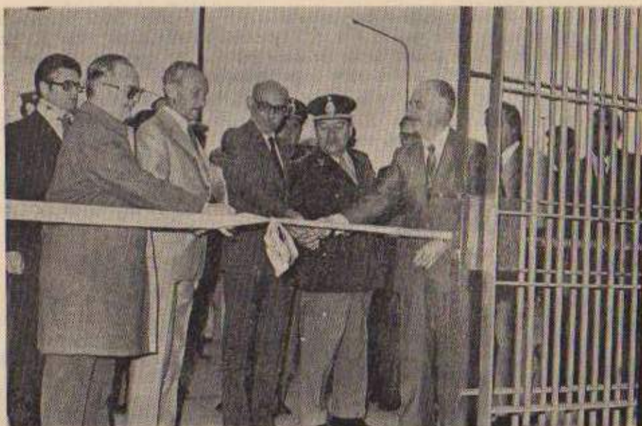
Momento en que es cortada la cinta y queda oficialmente inaugurada la Unidad 15 —Mar del Plata—.

j) Programar y fiscalizar los cursos de capacitación laboral para corta, mediana y larga duración, mediante la celebración de convenios con organismos educacionales oficiales o privados.