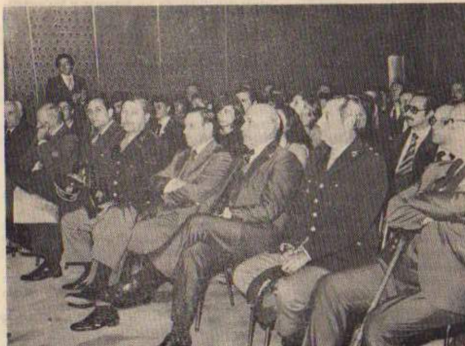
Autoridades y jóvenes estudiantes y profesionales escuchan la exposición del Señor Gobernador de la Provincia, en la Unidad II (Baradero).