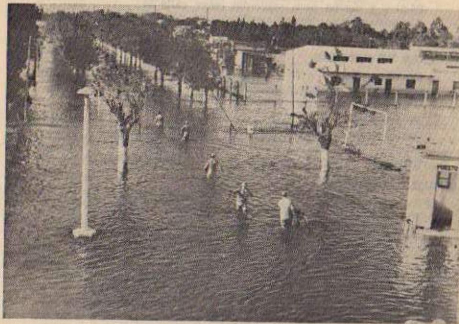
Aspecto que presentaba el acceso a la Unidad 7 (Azul), durante las inundaciones soportadas durante 1980.